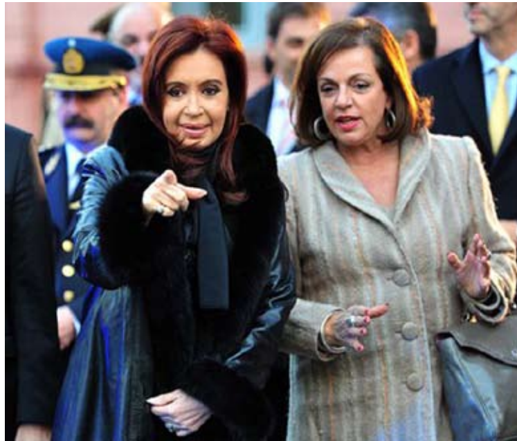
La Presidenta y la Ministra Garré entregaron equipamiento y asignaron 2.500 hombres para la seguridad de la Zona Sur.

La Presidenta presentó el Plan de Seguridad Cinturón Sur que incorpora 2500 efectivos de gendarmería y prefectura al patrullaje de los barrios de La Boca, Barracas, Patricios, Pompeya, Soldati y Villa Lugano.