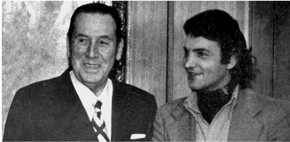
Dante Gullo junto a Juan Domingo Perón en los años '70.

A pesar de los descalabros y entregas más ignominiosas,