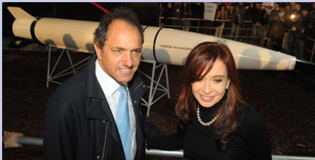
Cristina agradeció al gobernador Scioli y al intendente García por su ayuda para concretar Tecnópolis: Unidos podemos.

(Fragmento de la nota publicada en: http://www.pagina12.com.ar/diario/elpais/1-172322-2011-07-15.html )